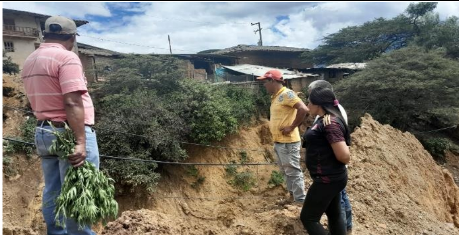
FIGURA N°01: RECORRIDO E IDENTIFICACION DE TRAMOS CRÍTICOS DESDE EL PUNTO DE INICIO, DONDE SE PUEDE VISUALIZAR QUE LA QUEBRADA EN SU MARGEN DERECHA E IZQUIERDA AFECTADO A VIVIENDAS Y PARTE DE LA CARRETERA DESTRUIDA.