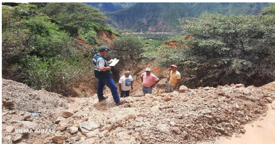
FIGURA N°02: EN EL RECORRIDO SE OBSERVA QUE EL RIO, EN SU MARGEN DERECHA E IZQUIERDA VIENE AFECTADO PARTE DE LA CARRETERA TOTALMENTE DESTRUIDA