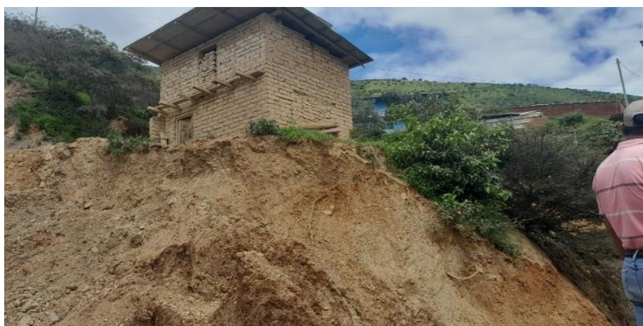
FIGURA N°03: EN TRAMO DE LA QUEBRADA HA AFECTADO A LAS VIVIENDAS Y LA CARRETERA